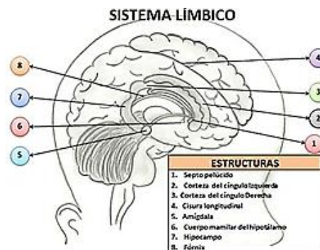
Figura 3. Componentes estructurales y funcionales del sistema límbico

Fuente Saavedra, Díaz C, Zúñiga, Navia, & Zamora (2015)