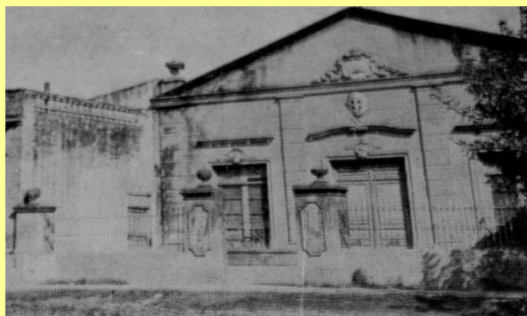
Sociedad Italiana donde se pronunciara el Grito de Alcorta el 25 de Junio de 1912

primeras migraciones argentinas, que nuestro país más que ningún otro, asimiló a obreros y agricultores revolucionarios que trajeron esas experiencias a estas tierras americanas. La mayor parte de los inmigrantes no tuvieron acceso a la propiedad de la tierra y debieron radicarse como arrendatarios en los distintos pueblos de la provincia. Los beneficios que producía la tierra no alcanzaron nunca a satisfacer ni medianamente las necesidades de los arrendatarios, muchos de los cuales dejaron hasta sus propias vidas sobre campos ajenos.