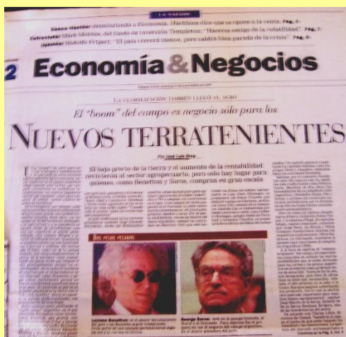
Según “La Nación”, el boom del campo es negocio sólo para los “Nuevos Terratenientes”