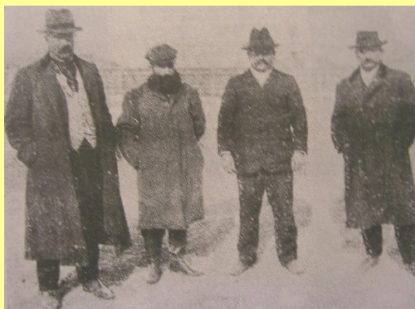
“Dirigentes Agrarios de Alcorta”-Junio de 1912

Aunque en el informe había más todavía, estos párrafos denuncian las arbitrariedades que cometían los terratenientes contra la masa campesina . Verdades de a puño pregonaron los funcionarios radicales. La Comisión señalaba que la solución estaba: