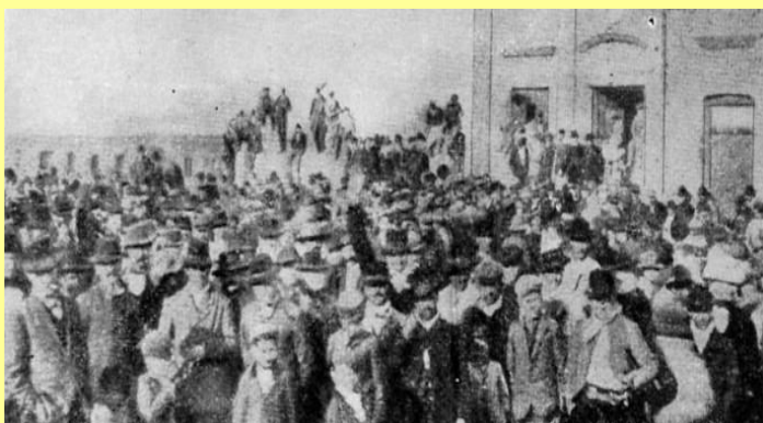
Asamblea de colonos en Alcorta-25 de Junio de 1912

Para morigerar la reacción que producen las bravuconadas que se observan en los cortes y la intemperante actitud que ellas expresan, quieren ocultar la autoría de las consecuencias que indudablemente van a producir, y con ese objetivo pretenden desviar la atención y argumentan que es culpa del gobierno al haber resuelto aplicar retenciones móviles a las exportaciones de cereales -su preocupación fundamental es la que se aplica a la soja-, medida que sólo disminuye las extraordinarias ganancias que están recibiendo por los precios internacionales de esos “ commodities ”.