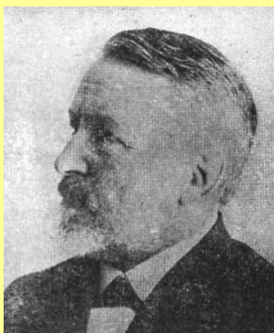
Dr. Juan B. Justo

Mientras en los pueblos de la provincia se repetían las concentraciones agrarias. Era su lucha contra el “régimen”, palabra con la que Yrigoyen designó a los gobiernos nacionales y provinciales, que se instalaron desde 1880. El régimen era la usurpación de la soberanía por un grupo de hombres, por una oligarquía. Era una “conjuración oficial” que todo lo arrasa (conf., Manuel Gálvez, “ Vida de Hipólito Yrigoyen. El hombre del misterio ”, 2ª edición, Buenos Aires, 1939, pág. 164). La oligarquía