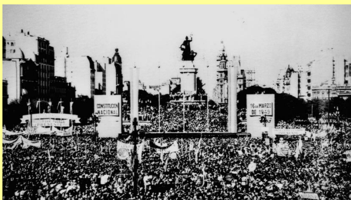
El Pueblo jura la Constitución Nacional de 1949

Se argumentó que fue sancionada una vez vencido el término que tenía fijado para sesionar la convención y por ende, fenecido el mandato que se le había otorgado a los constituyentes. Se invocó la “restricción